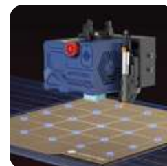
Nivelación Anycubic LeviQ