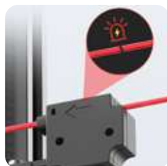
Detección de agotamiento de filamento