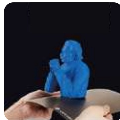
Plataforma flexible ultra resistente