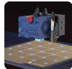
Nivelación Anycubic LeviQ