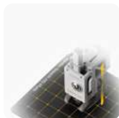
Calibración automática completa