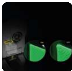
Compensación activa del caudal