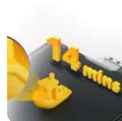
Bed Slinger, con velocidad y calidad CoreXY