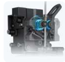
Extrusora de accionamiento directo