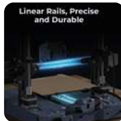
Rieles lineales, precisos y duraderos