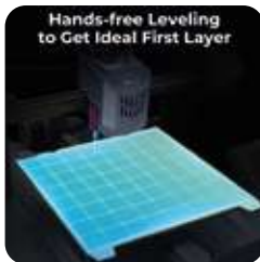
Nivelación automática manos libres

La impresora 3D CR-10 SE es una impresora FDM de gran formato fabricada por Creality. Con un volumen de construcción que la hace ideal para imprimir objetos grandes y complejos.