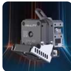
Extrusor Sprite de metal