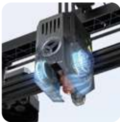
Ventiladores de refrigeración dobles