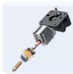
Hotend con calentador cerámico