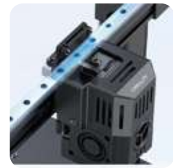
Eje X con riel de acero