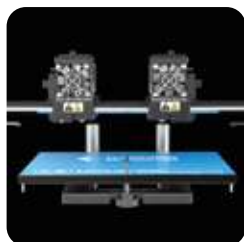
Extrusores duales independientes